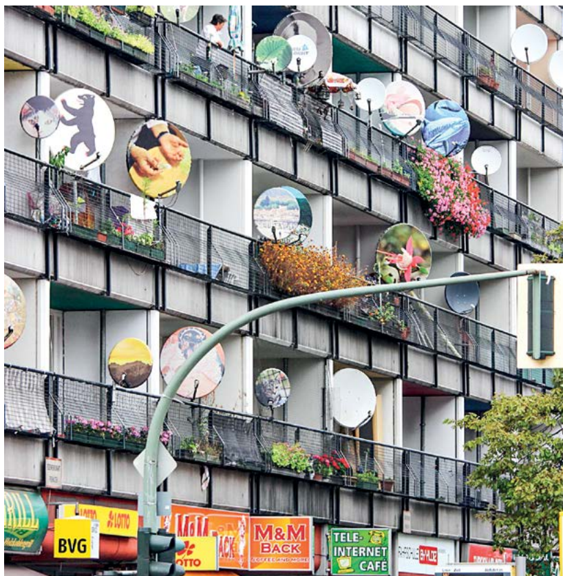
Pestré satelity, naladěné nezřídka na turecké televizní kanály. Jedna z tváří přistěhovaleckého Berlína