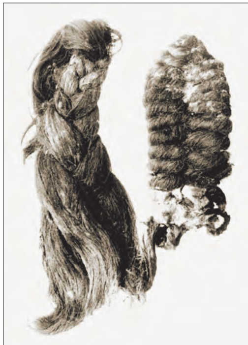
Pozoruhodné příčesky lidských vlasů u loutek a mumií takzvané taštycké kultury.

Při směřování dále na východ, na Sibíř, se vědci setkali s mumii taštycké kultury, s lidmi, kteří žili za Jenisejem v 6.–1. století př. n. l. Mimořádný objev u Abakanu v oblasti masivu Oglachty se udál v roce 1902, kdy se pastýř, hledající hříbě, propadl do hrobky. Rok nato se tam s carskými povoleními vydal Alexandr Adrianov a našel tam ostatky mumií, zvláštní vycpávané figurky, ale i hroudy