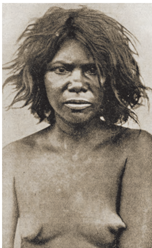
Žena Veddu z Ceylonu (Srí Lanka, 19. století).

O vlasech obyvatel jedné z jižních částí Asie psal už Plinius Starší, když zmiňuje výpravu za Claudiovy vlády (41–54), která se dostala až k ostrovu Taprobané (zřejmě Cejlon), kde žili „lidé ryšavých vlasů, modrých očí a vysoké postavy“. 427 Daleko staršími důkazy