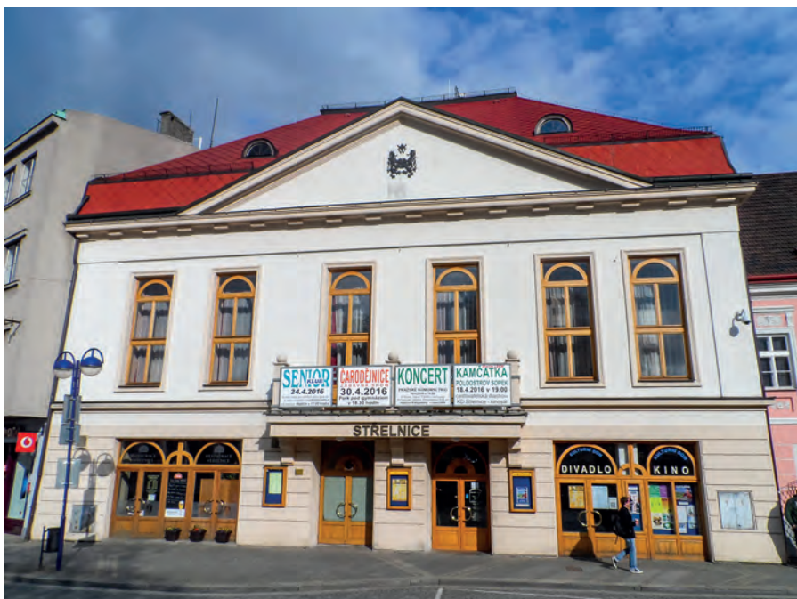
Obr. 67: Kulturní dům Střelnice v Jindřichově Hradci.