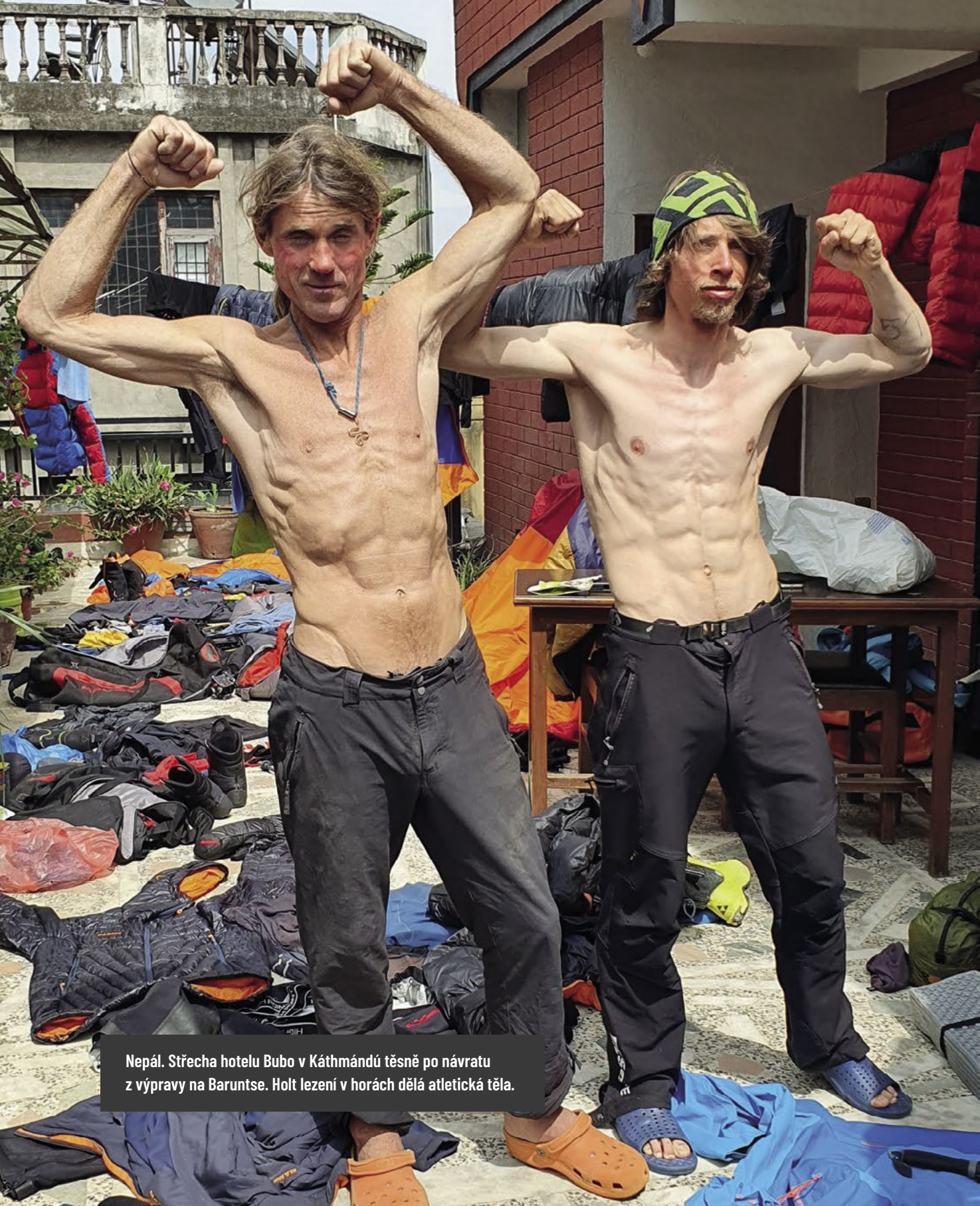
Nepál. Střecha hotelu Bubo v Káthmándú těsně po návratu z výpravy na Baruntse. Holt lezení v horách dělá atletická těla.