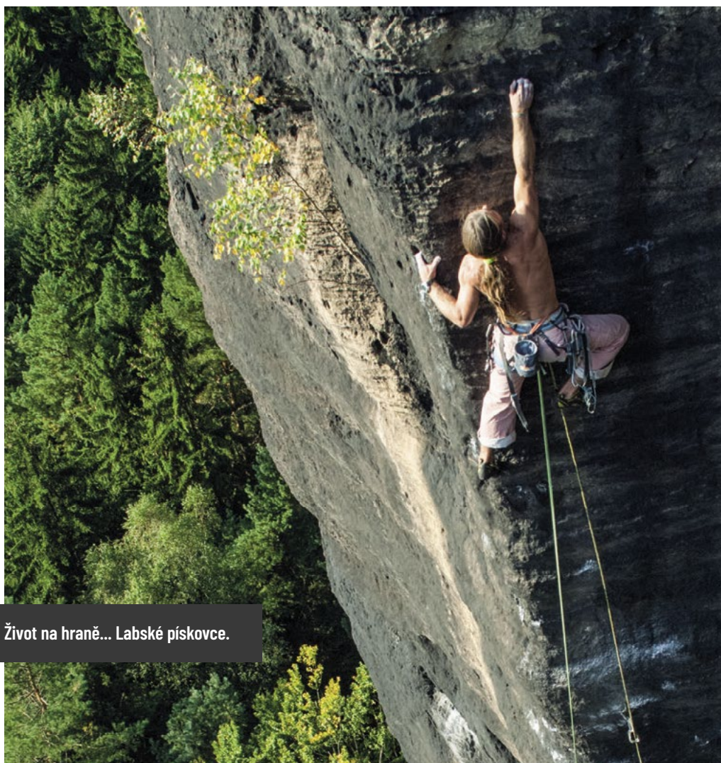
Život na hraně... Labské pískovce.