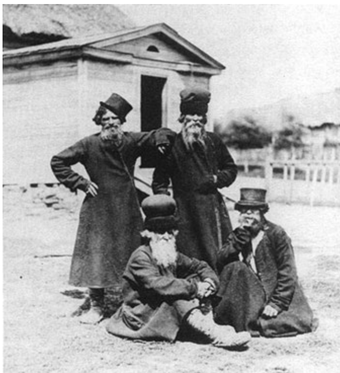
1. Ruští rolníci z Orlovské gubernie, pozdní 19. století.

V únoru 1861 podepsal Alexandr II. dekret, kterým s okamžitou platností zrušil nevolnictví, půdu přidelil rolníkům a daroval jim hotovost rovnající se částce za pronájem půdy na 49 let, jejímž prostřednictvím měli odškodnit své bývalé pány za pozemky, o něž tito přišli. Základním odkazem nevolnictví, které trvalo přes 250 let, bylo odcizení rolníka společnosti. Vnutilo mu totiž pocit, že svět je nespravedlivý a člověk může přežít pouze prostřednictvím násilí a prohnání. S tímto vypěstovaným povahovým rysem bylo velmi těžké vychovat z rolníků skutečné občany.