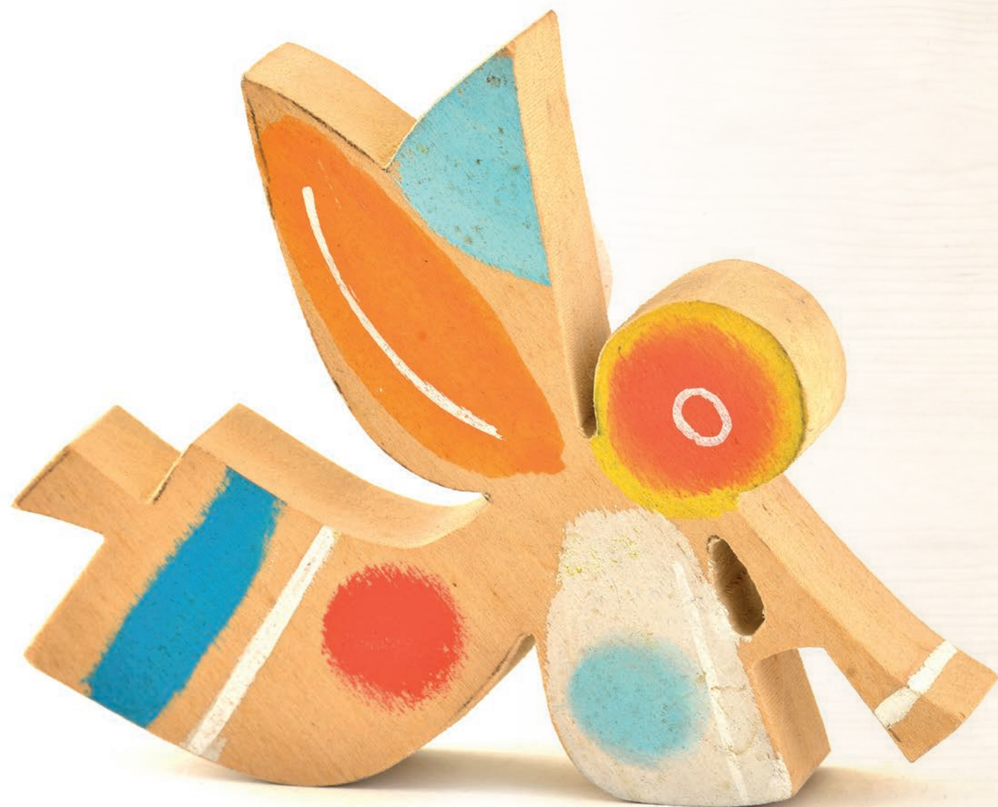
1980, drevo, polychrómia, 9 x 9 cm, súkromný majetok

Čo všetko nájdeš vo svojej izbe? Všimni si, koľko máš vecí na hranie. Kedysi hračiek nebolo. Deti si vystačili s dreveným koníkom alebo handrovou bábikou. To bolo radosti, keď nejaké otec priniesol z jarmoku!