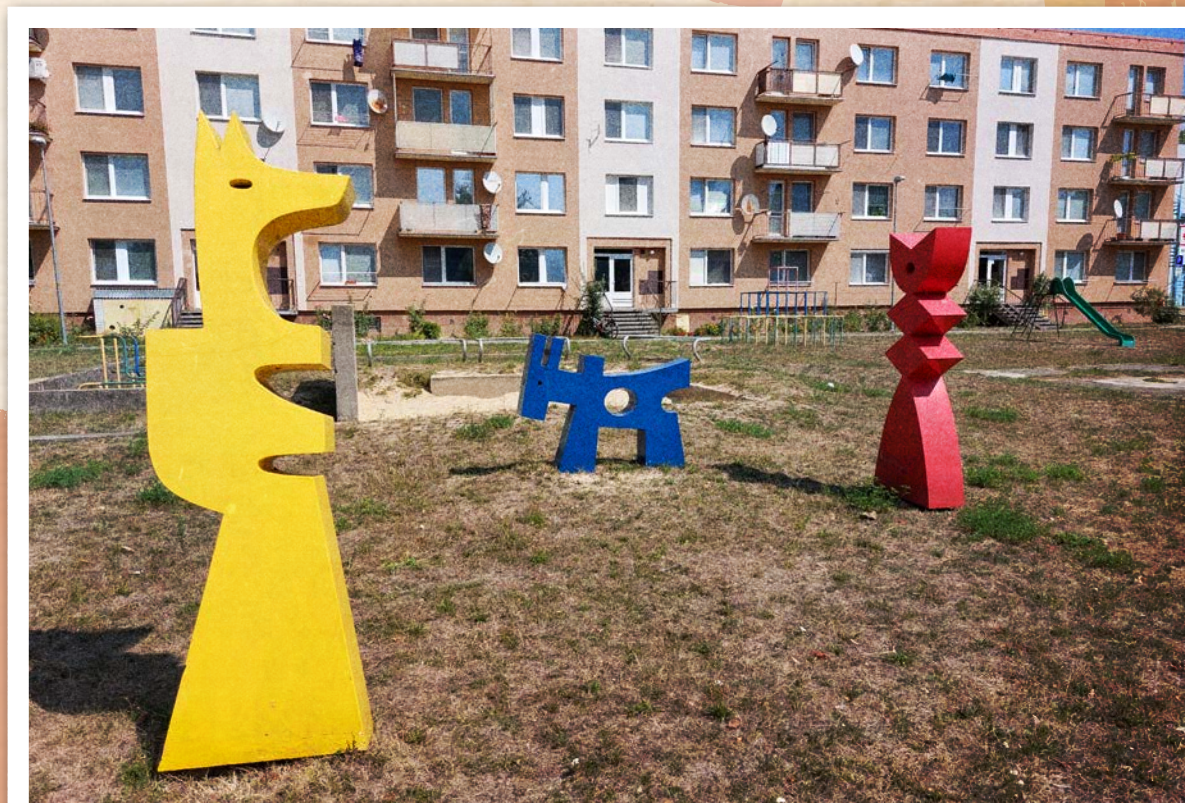
Plastiky Vladimíra Kompánka na sídlisku Prednádražie v Piešťanoch