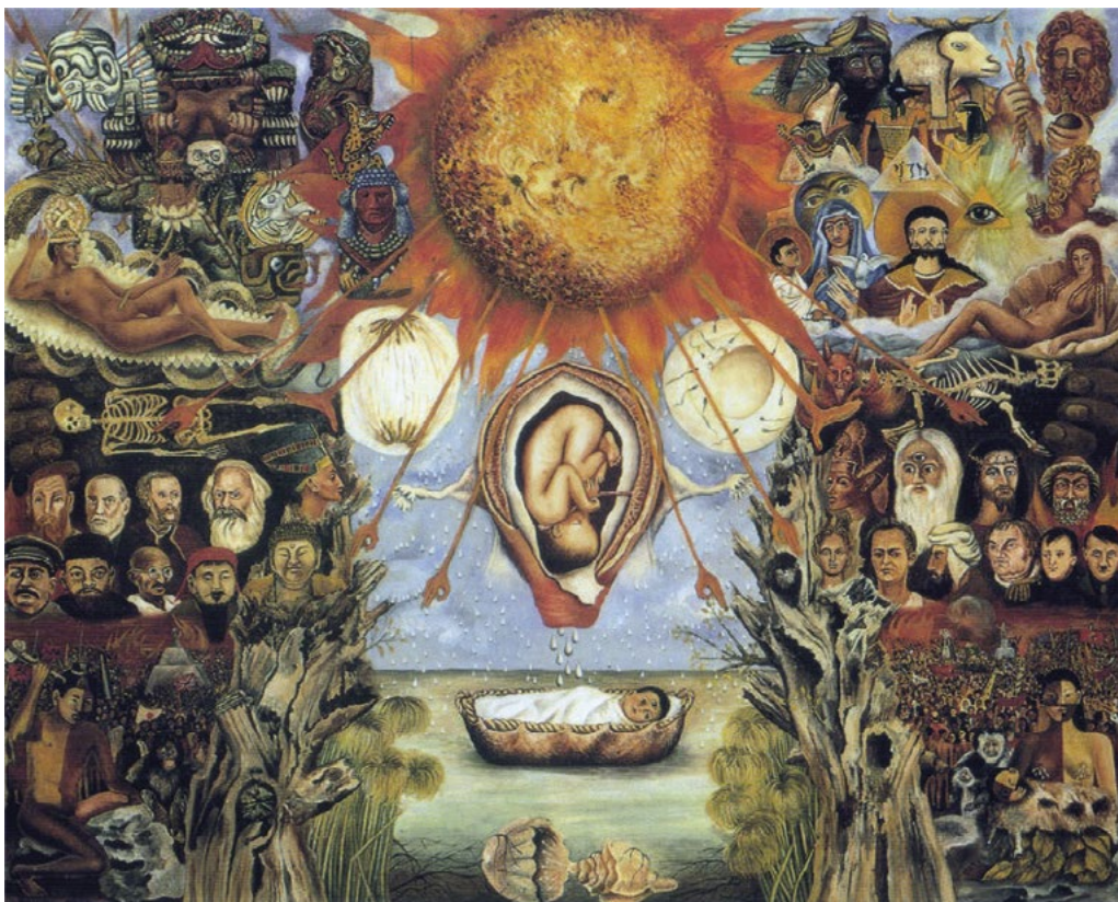
Frida Kahlo, Mojžiš, Zrození hrdiny , 1945, v soukromé sbírce

to několik lidových rčení, například: „Kam jde kmotra s márama, tam jde brzo s křtinama.“