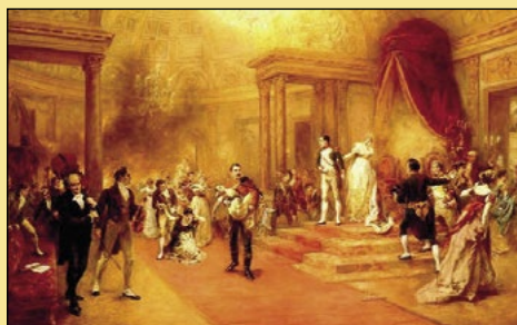
Požár na plesu pořádaném Josefem Schwarzenbergem

Dne 1. července 1810 vystrojil kníže Josef Schwarzenberg Napoleonovi přehnaně nákladný zásnubní ples. Když byla zábava v plném proudu, vypukl od převržené svíčky požár. Na šílící davy uvnitř sálu začaly padat hořící drapérie, od nichž se vznalyšaty nešťastníků. Jan Schwarzenberg později identifikoval ohořelé tělo své šestatřicetileté těhotné manželky kněžny Pauline jen podle jejích klenotů – měla na sobě 627 diamantů. Její stříbrná čelenka se roztavila a propálila jí hlubokou brázdou do lebky.