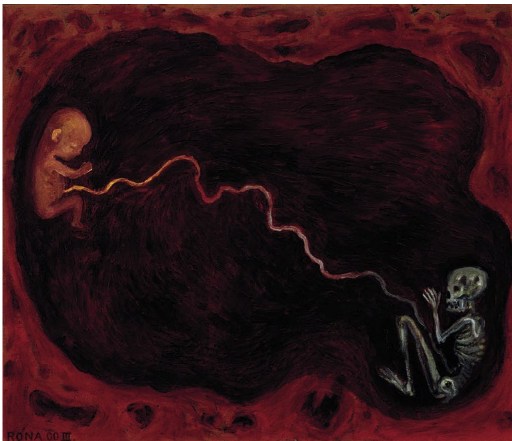
Jaroslav Róna, Kaluz , olej na plátně, 2000/3

ale respekt ke koloběhu života se vytratil z naší emocionality. Ideální stav na individuální úrovni by byla nekonečná expanze – ať nikdy nikdo ne onemocní, ať rodiče nikdy nezemřou a děti ať se rodí. Hroučíme se při diagnóze rakoviny, na pohřbech pláčeme. I smrt psa v nás dokáže vyvolat trauma, nového psa zakoupíme z množírny přes internet a fenu necháme co nejdříve vykastrovat. Stejně tak mnohým rodinám připadá normální vynakládat spoustu energie a obrovské sumy peněz na prodlužování života umírajícího člověka a současně dcery a vnučky berou antikoncepci či