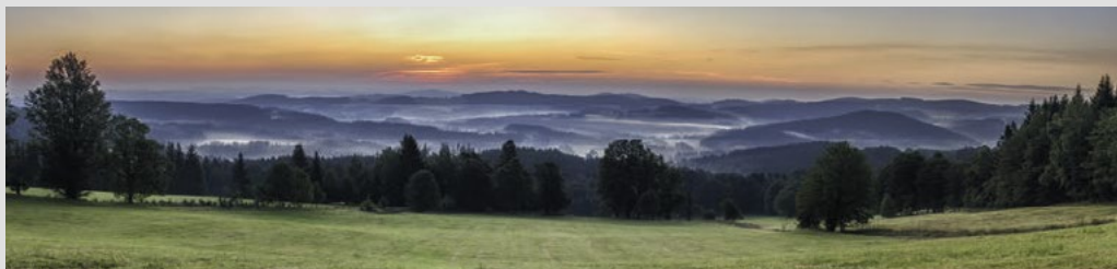
Karel Klostermann: Ze světa lesních samot, 1892

života je úžasná. Teprve po odchodu lidí mezi lety 1945 a 1950, tedy odsunu Němců a vytvoření pohraničního pásma, mohla začít fáze obnovy vegetace a příběh znásilněné Šumavy mohl být po více jak sto padesáti letech dovršen návratem vlka na toto území. Po několika sporadických návštěvách se teprve roku 2016 vlk vrátil natrvalo. Domov tu našel smíšený evropský pár, k samci pocházejícímu z Itálie se přidala samice, jejíž původ je z populace na pomezí Polska a Německa. Podařilo se jim vyvést a vychovat mladé, a tak se vytvořila i druhá vlčí smečka na pomezí Šumavy a Bavorského lesa. Odstřelený kostel v Prášilech, vesnice srovnané se zemí, rozbité náhrobky s německými jmény, zpřetrhaná paměť Sudet, to je cena za přítomnost vlčích mláďat v údolí říčky Křemelná. Možná se vrátí i Bejválek. I když kalamita způsobená orkámem Kyrill v roce 2007 se zdála děsivá a kůrovcová kalamita v letech následných dávají Šumavě zabrat, zdá se, že to vlčí populace zvládne.