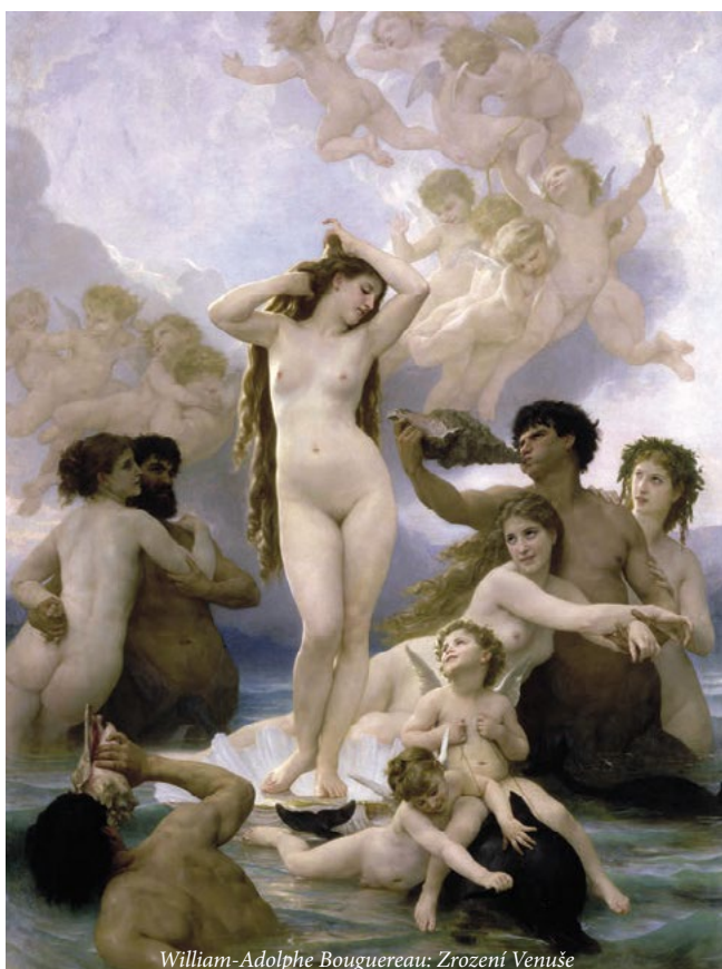
William-Adolphe Bouguereau: Zrození Venuše