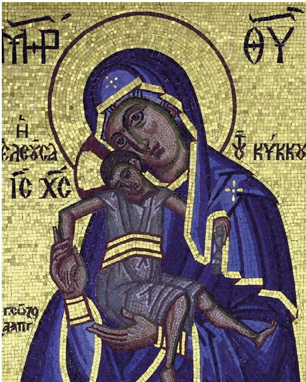
Mozaika zobrazující Pannu Marii s dítětem v klášteře Kykkos na Kypru.

„Proč?“ ptají se mnozí. „Není vůbec potřeba zjišťovat příčiny vaší neplodnosti. Je to ztráta